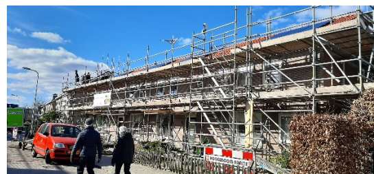
volop aan het werk in de Julianalaan