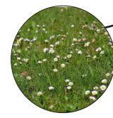
Gras met bloemmengsel